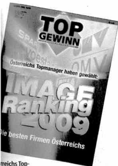
Österreichs Topmanager haben gewählt: Die besten Firmen Österreichs im großen GEWINN-Image-Ranking 2009